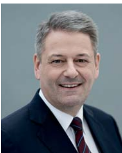
Ihr ANDRÄ RUPPRECHTER Bundesminister für Land- und Forstwirtschaft, Umwelt und Wasserwirtschaft

Viel Erfolg bei der Ausrichtung und viel Spaß bei der Teilnahme an Green Events und Green Meetings!