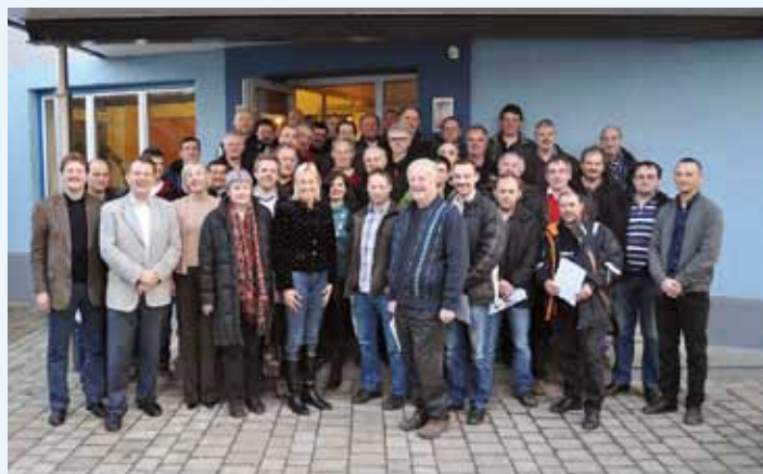
„Frischgebackene“ Wassermeister Leibnitz 2011

ReferentInnen aus der Praxis garantieren, dass neben theoretischer Wissensvermittlung auch der Erfahrungsaustausch nicht zu kurz kommt. Am dritten Tag der Ausbildung bekommen die TeilnehmerInnen im Rahmen einer Exkursion zu einem Wasserversorgungsunternehmen die Möglichkeit, das Gelernte vor Ort zu sehen und mit Praktikern zu diskutieren. Die Durchführung und Beurteilung der schriftlichen Prüfung erfolgt durch die ÖVGW.