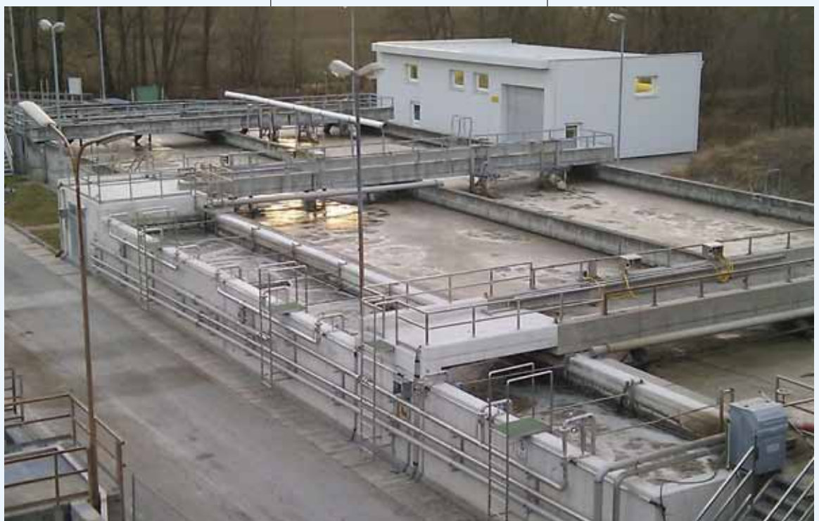
Betriebskläranlage Wollsdorf Leder