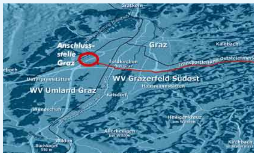
Verlauf der Transportleitung Oststeiermark

Ohne Vernetzung und die 60 Kilometer lange oststeirische „Wasserader“ TLO wäre die Versorgungssicherheit