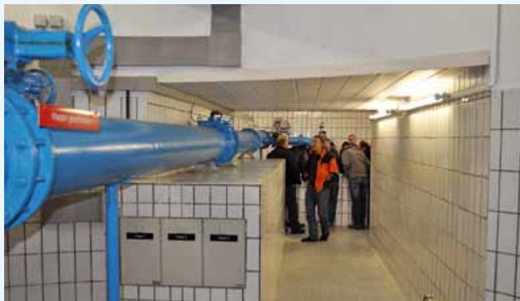
Im Rahmen der Schulungen wurde auch ein Brunnen der Stadtwerke Bruck an der Mur besichtigt