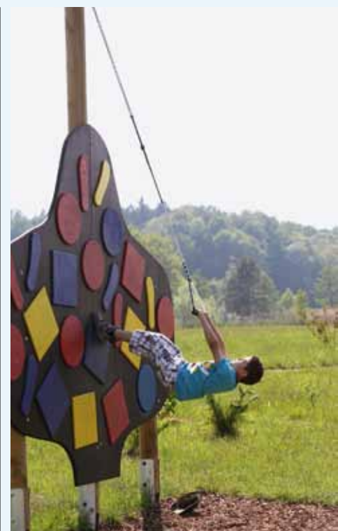
Bewegungs-Angebote im Areal der Gamlitzer Landschaftsteiche

Die Nutzung des Parks ist kostenlos. Auf Wunsch können zudem Personal-Coaches für das eigene Training gebucht werden. Neugierig geworden? Nehmen Sie sich Zeit und entdecken Sie den neuen Motorikpark im Rahmen eines unvergesslichen Südsteiermark-Ausfluges.