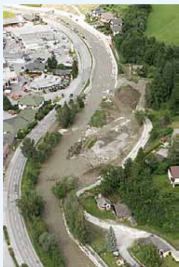
Beginn der Maßnahme im Ortszentrum (Wirtschaftspark) von Aigen

In der Gemeinde Aigen im Bezirk Liezen wurden im Rahmen eines wasserrechtlichen Projektes das Gefährdungspotential des Gullingbaches für dreißig- bzw. hundertjährige Hochwässer (HW 30 bzw. HW 100 ) erhoben und geeignete Schutzmaßnahmen zur Abwehr möglicher zukünftiger Überflutungen erarbeitet.