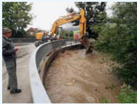
Hochwasser im Ausbaubereich Aigen-Ketten am 21. Juli 2012

errichtet werden. Darüber hinaus waren zahlreiche Maßnahmen vorgesehen, um die ökologische Funktionsfähigkeit des Fließgewässers zu erhalten bzw. zu verbessern und dem Fluss möglichst viel Raum zu lassen. Im Vordergrund standen dabei die Schaffung von überflutbaren Sukzessionsflächen in Kombination mit einer vielfältigen Gewässerstruktur, Stillwasserbereiche oder standortgerechte Bepflanzung der Uferböschungen. Durch Abtragen eines Wehres aus Beton (Schiestlwehr) und Errichtung einer moderaten Rampe wurde außerdem das Fließkontinuum des Flusses wiederhergestellt. Abschließend kann man feststellen, dass trotz der Hochwasserschutzmaßnahmen der Gullingbach auch weiterhin nahezu unverändert in die Enns fließt.