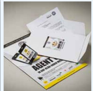
Presseunterlagen zu „Agent 00 – Der Spülfilm“