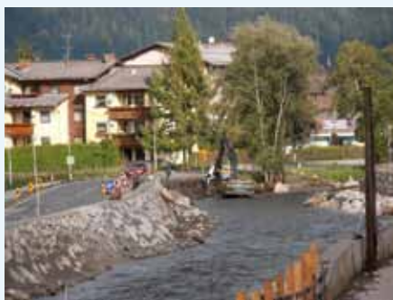
Arbeiten am Ausbau im Ortsteil Ketten