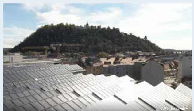
ÖKOPROFIT Werbevideo (erstellt von AVbaby Filmstudio OG)