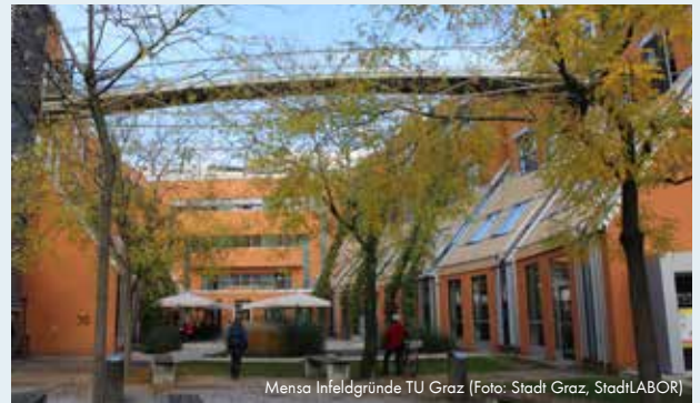
Mensa Infeldgründe TU Graz