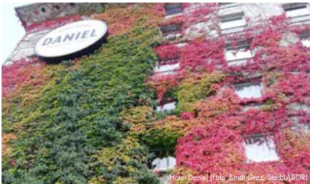
Hotel Daniel