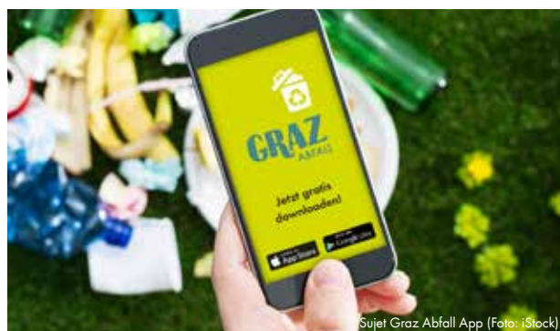
Objekt Graz Abfall App