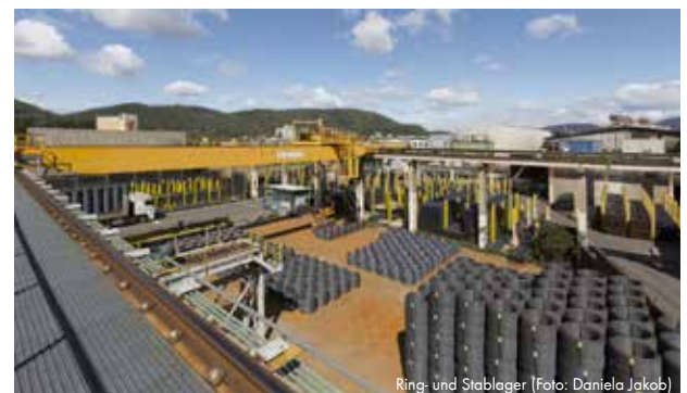
Ring- und Stablager