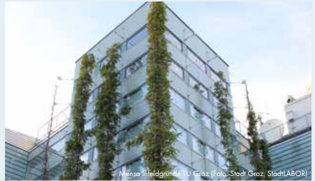
Mensa Infeldgründe TU Graz