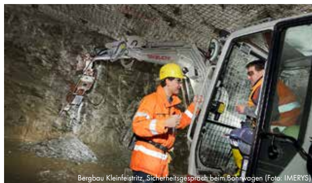
Bergbau Kleinfelzitz, Sicherheitsgespräch beim Bohrvagen