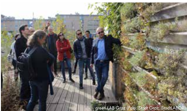
green.LAB Graz