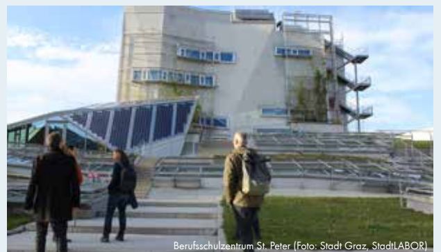
Berufsschulzentrum St. Peter