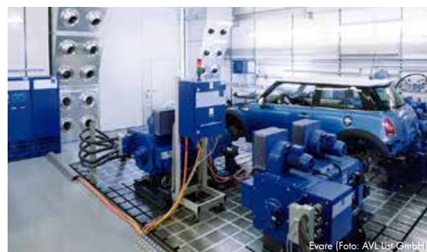
Evare