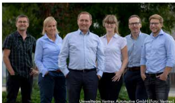
Umwelteam Ventrex Automotive GmbH