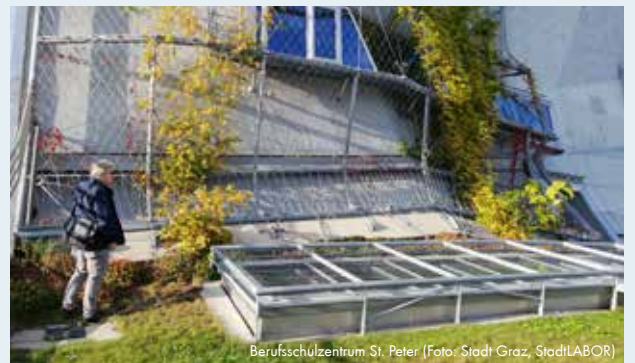
Berufsschulzentrum St. Peter