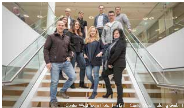
Center West Team