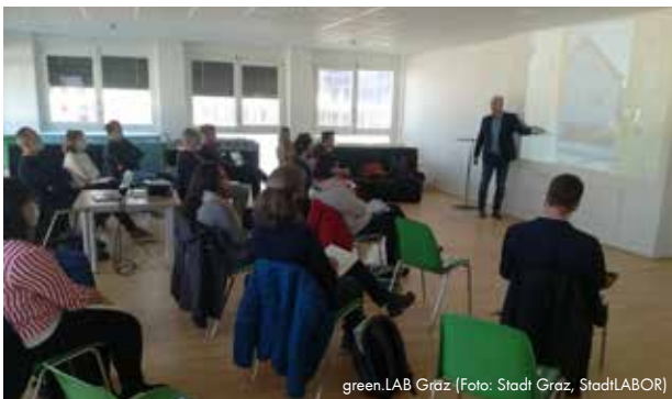
green.LAB Graz