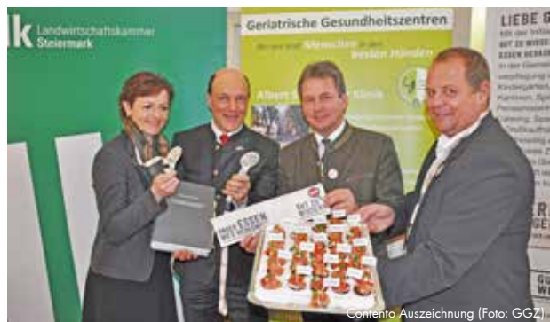
Contento Auszeichnung