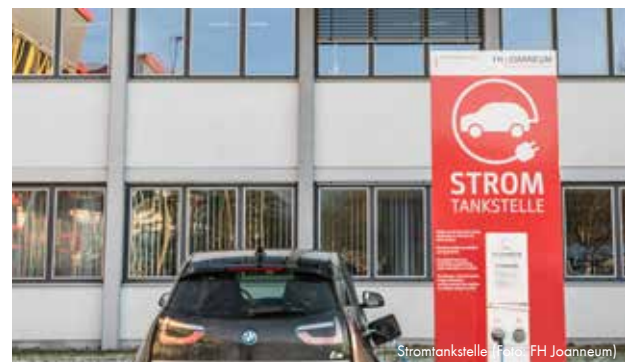
Stromtankstelle | Foto: FH Joanneum