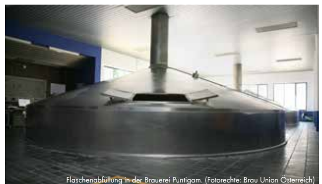
Flaschenabfüllung in der Brauerei Puntigam.