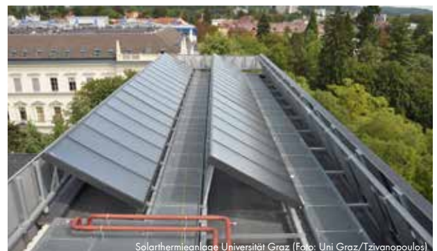
Solarthermieanlage Universität Graz