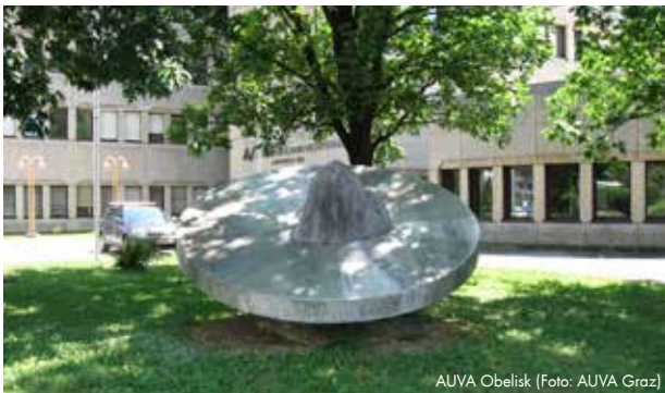
AUVA Obelisk