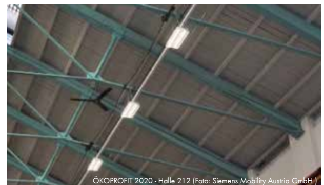
ÖKOPROFIT 2020 - Halle 212