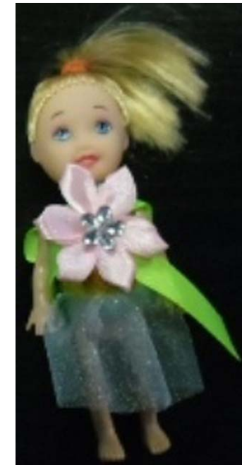
Puppen mit verbotenen Weichmacher