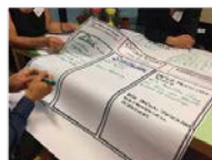
Workshops mit FachexpertInnen