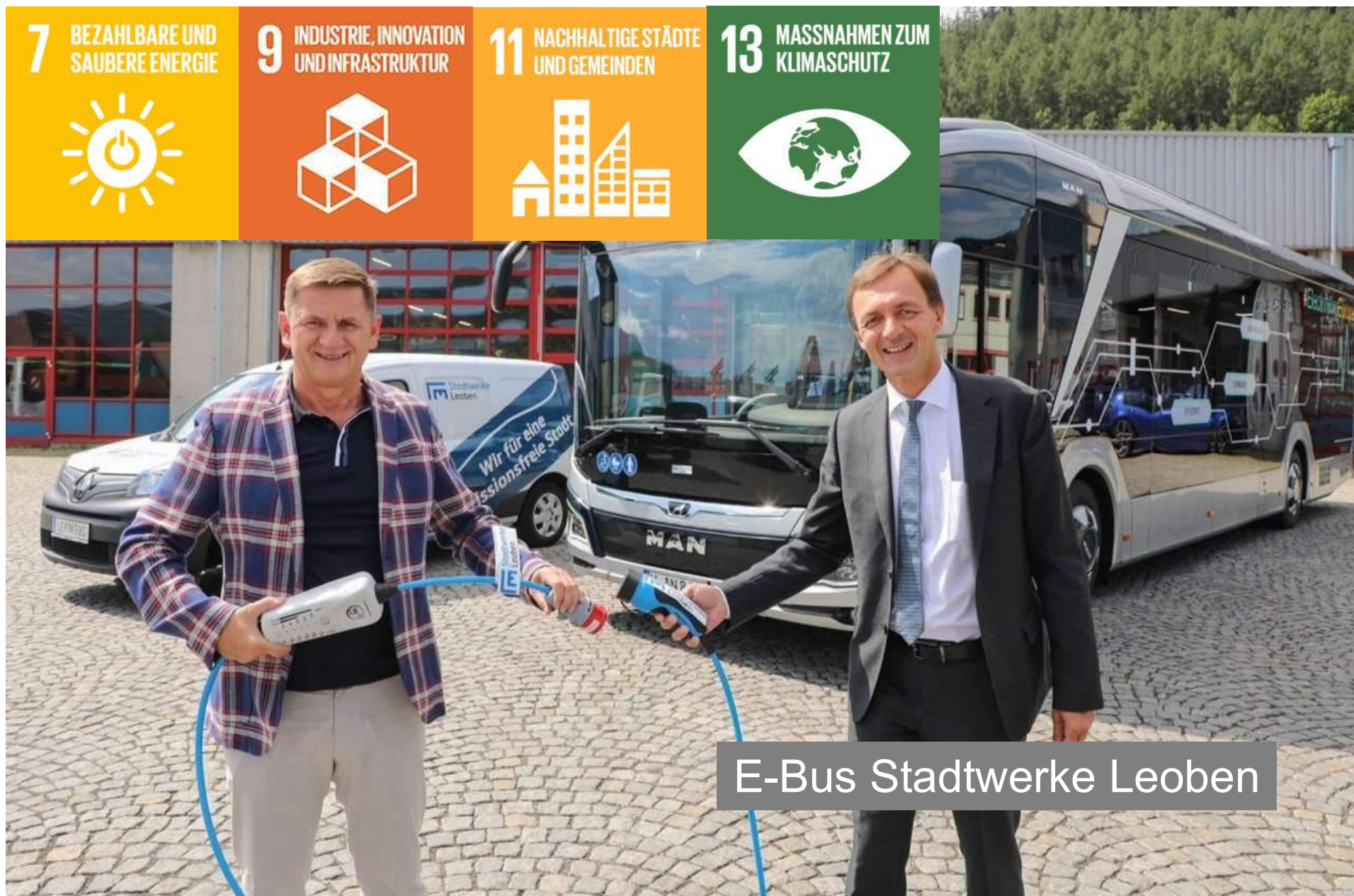
E-Bus Stadtwerke Leoben