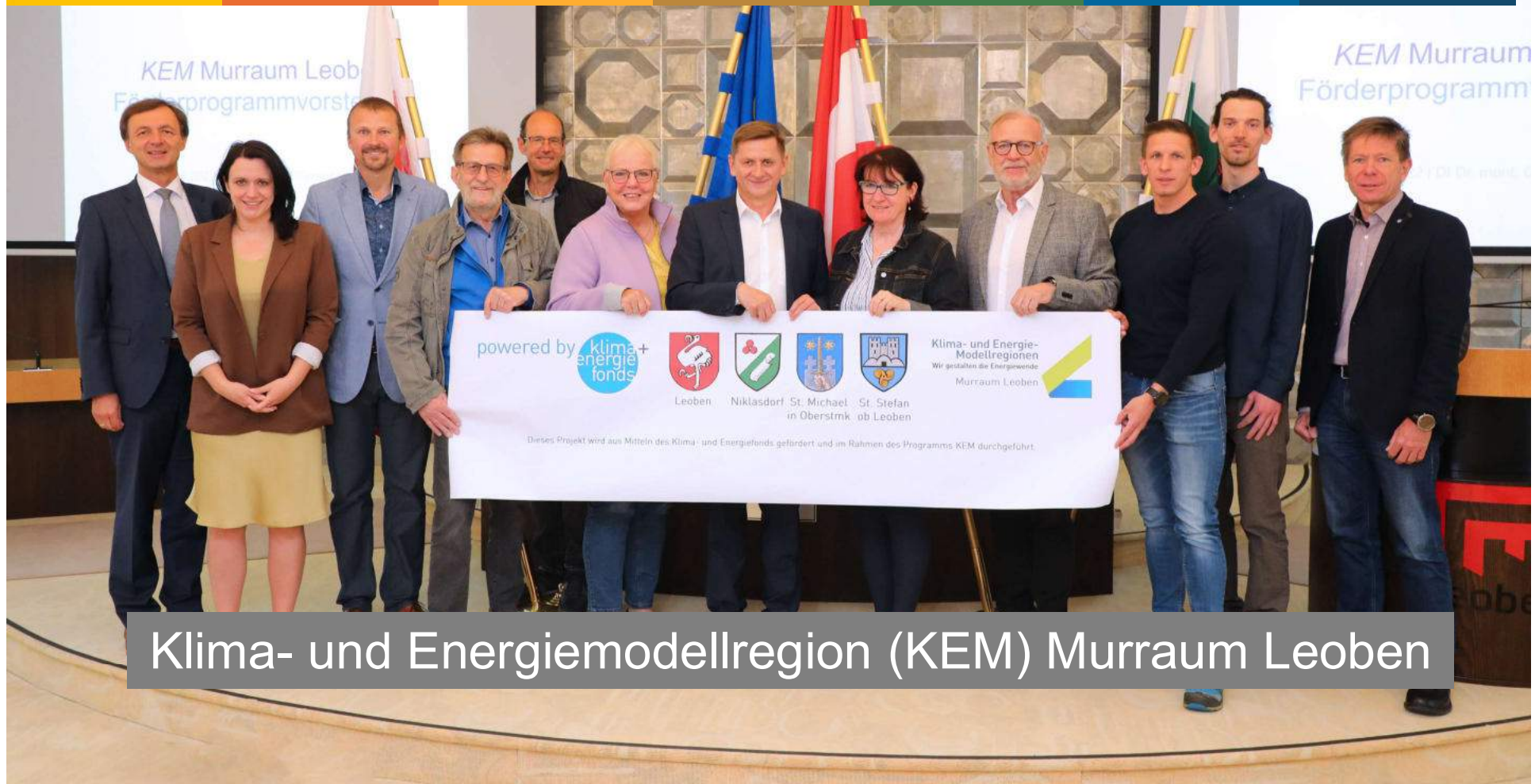
Klima- und Energiemodellregion (KEM) Murraum Leoben