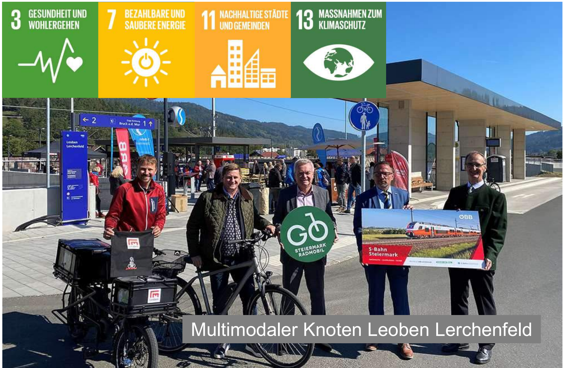
Multimodaler Knoten Leoben Lerchenfeld