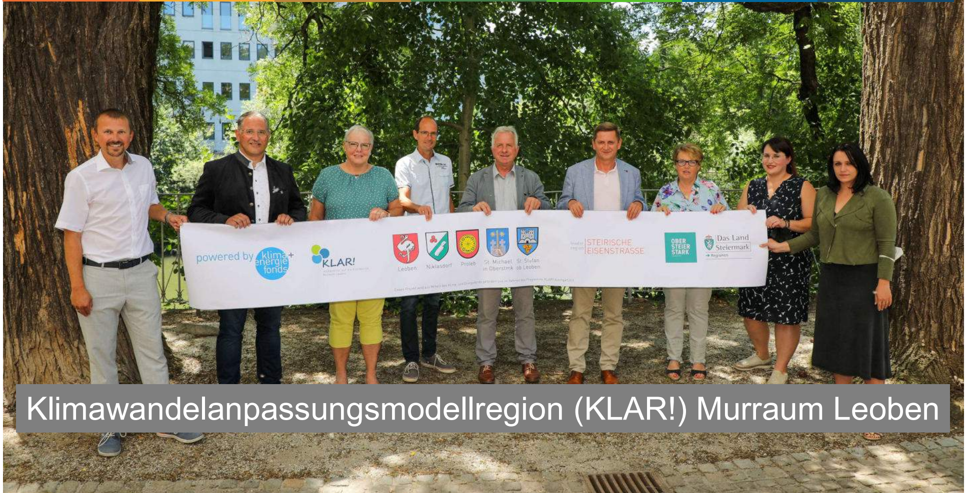
Klimawandelanpassungsmodellregion (KLAR!) Murraum Leoben