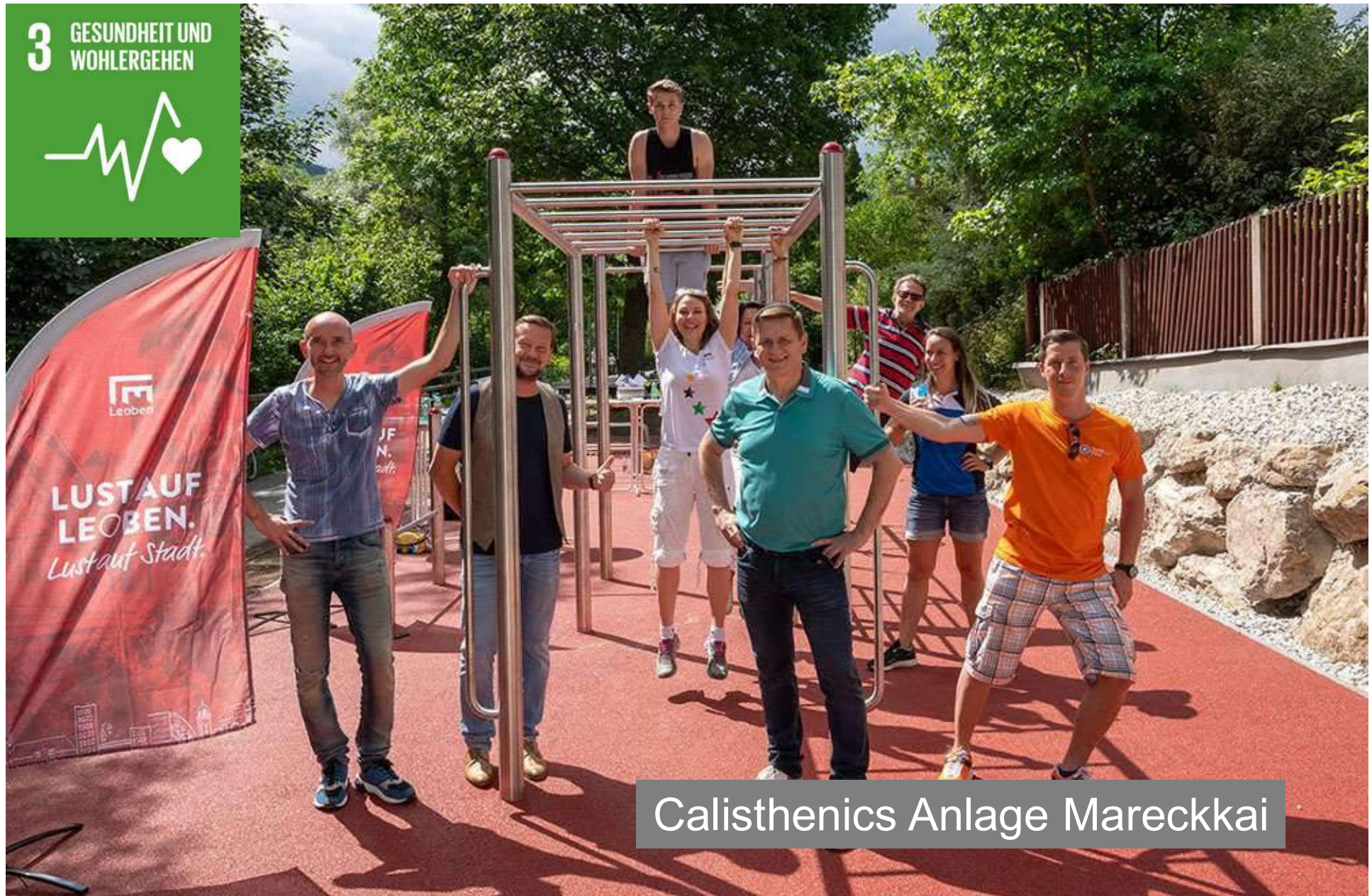
Calisthenics Anlage Mareckkai