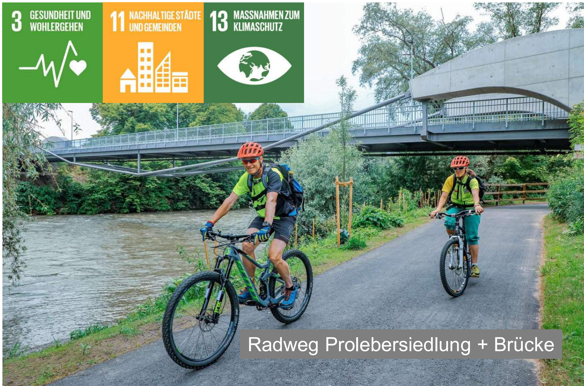
Radweg Prolebersiedlung + Brücke